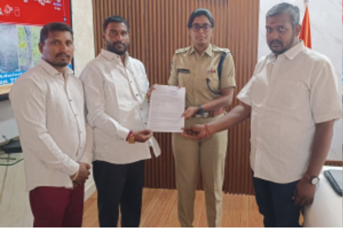
సికింద్రాబాద్, 13 ఏప్రిల్ (తెలంగాణ షాన్):