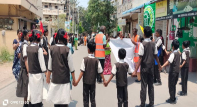
కాప్రా ఏప్రిల్ 13

ప్రజా పాలన ప్రగతి ప్రణాళిక 99 రోజుల కార్యక్రమంలో భాగంగా సోమవారం రోడ్ సేఫ్టీ డే, ఈ కార్యక్రమంలో ప్రభుత్వ ఆదేశాల మేరకు వివిధ ప్రభుత్వ విభాగాలు ఈ క్రింది తెలియజేసిన విధంగా రోడ్ సేఫ్టీ చర్యలు తీసుకోవాలి. 1. ప్రజలలో అవగాహన కార్యక్రమాలు నిర్వహించాలి. 2. పోలీసు విభాగం వారి సౌజన్యంతో వాహనదారులకు పాదుచారులకు ఇబ్బంది కలగకుండా అవగాహన కార్యక్రమాలు చేయాలి. ఇంజనీరింగ్ విభాగం రోడ్డుపై గుంతలు వూద్యాలి సానిటేషన్ విభాగం రోడ్డు పక్కన మట్టి చెత్త చెదారము రాళ్లు ఇసుక లేకుండా చూడాలి. 3. ఎలక్ట్రికల్ విభాగం వారు విద్యుత్ దీపాలు ఏర్పాటు రిపేర్లు చేయాలి. ట్రాన్స్మార్టర్లు