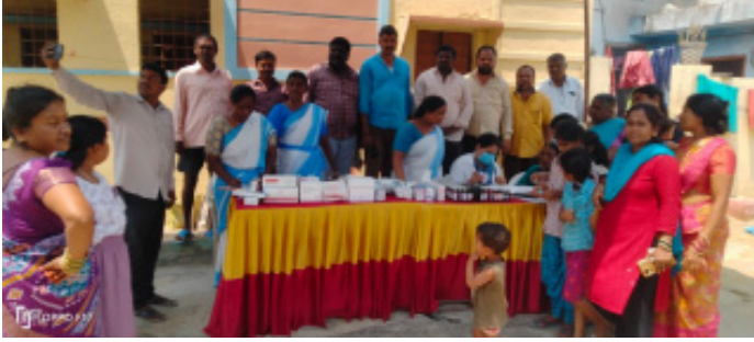
కార్మిక నగర్, డాక్టర్ రిషిక