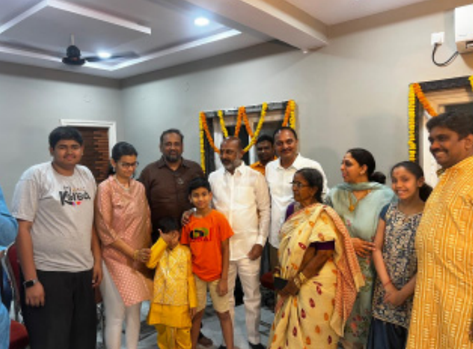
కాప్రా ఏప్రిల్ 13