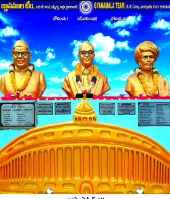
కాప్రా ఏప్రిల్ 13

జమ్మిగడ్డె జ్ఞానమాల టీమ్ ఆధ్వర్యంలో నేడు 14-04-2026 (మంగళ వారం) ఉదయం 10.00 గంటలకు బి జే ఆర్ కాలనీ, రోడ్ నంబర్ 10 లోని మహానియలు విగ్రహాల వద్ద భారత్ రత్న డా. బాబా సాహెబ్ భీంరావు అంబేద్కర్ గారి జయంతి సందర్భంగా 135వ జయంతి వేడుకలు నిర్వహించాడం జరుగుతుంది కాబట్టి అందరూ రావలసిందిగా విజ్ఞప్తి జ్ఞానమాల టీమ్