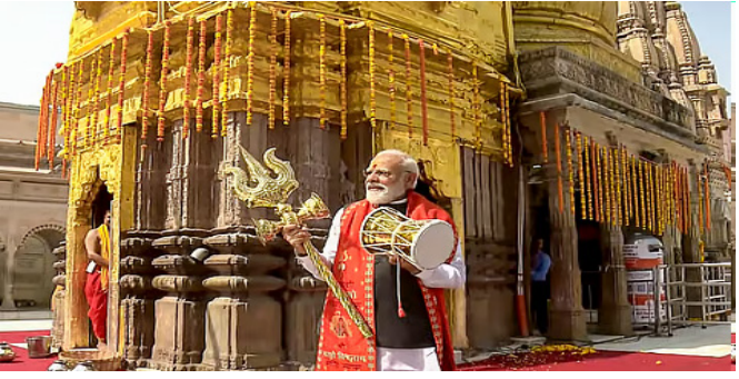
వారణాసి: ప్రధాని నరేంద్ర మోదీ ఇవాళ వారణాసిలో పర్యటిస్తున్నారు. ఇవాళ ఉదయం ఆయన కాశీ విశ్వనాథుడిని దర్శించుకున్నారు. అభిషేకం, అర్చన చేశారు. వారణాసిలో మెగా

రోడ్షో నిర్వహించనున్నారు. ఆ తర్వాత గంగా ఎక్స్ ప్రెస్ వెనుక ఆయన ప్రారంభించారు. విశ్వనాథుడి ఆలయంలో వేద మంత్రోచ్ఛరణల సదుపాయం అయిన పూజలో పాల్గొన్నారు. శివుడికి అభిషేకం చేశారు. ఛాత్రం ఇచ్చారు. మాతా అన్నపూర్ణదేవి, గంగా మాతలను కూడా ఆయన దర్శించుకున్నారు. ఆ పిక్చును మోదీ తన ఎక్స్ అకౌంట్లో రిలీజ్ చేశారు. హర్ హర్ మహాదేవీ అని ట్యాగ్ చేశారు. కాశీలోని బాబా విశ్వనాథ్ మందిరంలో దర్శనం, పూజ చేయడం సాభాగ్యంగా భావిస్తున్నట్లు తెలిపారు. దేశంలోని ప్రతి పౌరుడు సుఖంతోపాటుగా, ఆరోగ్యంగా జీవించాలని బోధనాభూమిని వేడుకున్నట్లు తెలిపారు. మాతా అన్నపూర్ణేశ్వరి, గంగా మాతల దర్శనం తనకు గాఢమైన శాంతిని ఇస్తుందన్నారు. ఆమె వల్లని చూపు ప్రతి ఒక్కరిలో పాజిటివ్ ఎనర్జీ ఇవ్వాలని ఆశిస్తున్నట్లు తెలిపారు. కాశీ ప్రజలకు మరోసారి వందనాలు అంటూ మోదీ తన పోస్ట్లో రాశారు.