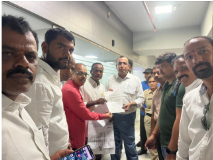
కాప్రా జూన్ 10