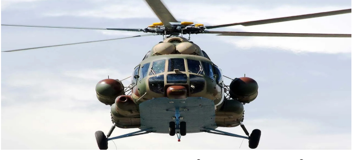
గల కచ్చితమైన కారణాలను తెలుసుకునేందుకు పాకిస్థాన్ ఆర్మీ దర్యాప్తు ప్రారంభించింది. సాంకేతిక లోపమే ప్రమాదానికి కారణమని ప్రాథమికంగా భావిస్తున్నట్లు.. పూర్తి వివరాలు విచారణ అనంతరం వెల్లడయ్యే అవకాశం ఉంది. ముజఫరాబాద్ ప్రాంతంలో జరిగిన ఈ ఘటన పాకిస్థాన్ సైనిక చరిత్రలో విషాదాన్ని నింపింది.

న్యూఢిల్లీ, జూన్, 10: యూపీ దేశం పాకిస్థాన్లో ఘోర విషాదం చోటుచేసుకుంది. పాకిస్థాన్ ఆర్మీ ఏవియేషన్కు చెందిన ఎంఐ-17 హెలికాప్టర్ ముజఫరాబాద్ సమీపంలో టేకాఫ్ అవుతున్న సమయంలో కూలిపోయింది. సాంకేతిక లోపం కారణంగా కూలిపోయింది. హెలికాప్టర్లో ఉన్న సిబ్బంది అందరూ అమరులయ్యారని పాకిస్థాన్ మీడియా తెలిపింది. ఈ ఘటనలో ఎవరూ ప్రాణాలతో బయటపడలేదని ఇంటర్-సర్వీసెస్ బట్లీ రిపోర్ట్ (సూచన) ఉంటున్నట్లు పాకిస్థాన్ దాని పత్రిక వెల్లడించింది. హెలికాప్టర్లో 21 మంది సైనికులు ఉన్నట్లుగా తెలుస్తోంది. అందరూ చనిపోయినట్లుగా సమాచారం. ప్రమాదం జరిగిన వెంటనే సహాయక బృందాలు ఘటనాస్థలానికి చేరుకుని గాలింపు చర్యలు చేపట్టాయి. అయితే ప్రమాద తీవ్రత ఎక్కువగా ఉండటంతో ఎవరూ ప్రాణాలతో బయటపడలేదని అధికారులు వెల్లడించారు. హెలికాప్టర్లో ఉన్న సైనిక సిబ్బంది దేశ సేవలో అమరులయ్యారని పాకిస్థాన్ సైన్యం పేర్కొంది. ఈ ప్రమాదానికి