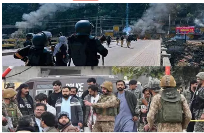
అందోళనలను అణచి వేయడానికి పాకిస్తాన్ కేంద్ర ప్రభుత్వం భారీగా పారామిలిటరీ బలగాలును పీఠికకు తరలించింది. రావల్ పోస్ట్, ముజఫరాబాద్ వంటి నగరాల్లో నిరసనకారుల రాబోయే ప్రాంతాల్లో భద్రతా బలగాలు క్రైమ్ రౌండ్ కాల్పులు, లాఠీఛార్జీ మరియు టీయర్ గ్యాస్ ప్రయోగం వంటి రకరకంగా మారింది.

హైదరాబాద్, జూన్ 11: పాక్ అక్రమిత కశ్మీర్ లో గత కొన్ని రోజులుగా ఉద్రిక్త పరిస్థితులు కొనసాగుతున్నాయి. నిరసనకారులపై ఇటీవల జరిగిన కాల్పుల ఫలితం మరణం మరణం, తాజాగా భద్రతా బలగాలు జరిపిన కాల్పుల్లో మరో 16 మంది ప్రాణాలు కోల్పోయినట్లు స్థానిక నివేదికలు చెబుతున్నాయి. ఈ తాజా మరణాలతో ఈ ప్రాంతంలో గత వారం రోజులుగా జరిగిన ఘర్షణల్లో మరణించిన వారి సంఖ్య 30 దాటినట్లు తెలుస్తోంది. ప్రస్తుతం పీఠికే పరిధిలోని ప్రధాన నగరాల్లో కర్ఫ్యూ విధించడంతో పాటు మొబైల్, ఇంటర్నెట్ సేవలను పూర్తిగా నిలిపివేశారు. జాయింట్ అవామీ యూత్స్ కమిటీ నేతృత్వంలో ఈ నిరసనలు ఉధృతంగా సాగుతున్నాయి.