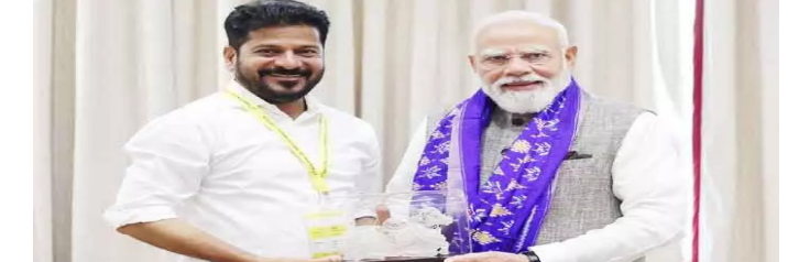
ను మంజూరు చేయాలని రేవంత్ రెడ్డి కోరారు. అలాగే, హైదరాబాద్ నగర రూపురేఖలను మార్చేలా, పర్యావరణ పరిరక్షణే ధ్యేయంగా రాష్ట్ర ప్రభుత్వం ప్రతిష్టాత్మకంగా చేపట్టిన మూసీ నది ప్రక్షాళన కార్యక్రమానికి కేంద్ర ప్రభుత్వం సంపూర్ణ ఆర్థిక, సాంకేతిక సహకారం అందించాలని సీఎం రేవంత్ ప్రకటించారు. దక్షిణ తెలంగాణకు పరప్రధాని అయిన జైపల్ రెడ్డి పాలమూరు-రంగారెడ్డి ఎత్తిపోతల పథకానికి సంబంధించి కేంద్ర జల సంఘం నుంచి త్వరగా క్లియరెన్స్ ఇప్పించాలని రేవంత్ రెడ్డి, సీఎం మోడీని కోరినట్లుగా తెలుస్తోంది.

హైదరాబాద్, జూన్ 11: దేశ రాజధాని ఢిల్లీలో జరిగిన 'నీతి ఆయోగ్' గవర్నింగ్ కౌన్సిల్ సమావేశం ముగిసింది. ఈ సమావేశానికి హాజరైన సీఎం రేవంత్ రెడ్డి సాయంత్రం ప్రధాని సరేంద్ర మోడీతో విడిగా భేటీ అయ్యారు. అత్యంత ప్రాధాన్యత సంతరించుకున్న ఈ సమావేశంలో రాష్ట్రానికి సంబంధించిన పలు పెండింగ్ ప్రాజెక్టులు, కేంద్ర ప్రభుత్వం నుంచి అందాల్సిన ఆర్థిక, సాంకేతిక సహకారంపై ఇరు నేతలు సుదీర్ఘంగా చర్చించారు. తెలంగాణ రహదారి రంగానికి, పారిశ్రామిక వృద్ధికి ఊతమిస్తే రీజినల్ రింగ్ రోడ్ల పనుల పురోగతిని సీఎం రేవంత్ ప్రధానికి వివరించినట్లుగా తెలుస్తోంది. ఈ ప్రాజెక్టును వేగవంతం చేసేందుకు అవసరమైన కేంద్ర నిధులను త్వరితగతిన విడుదల చేయాలని కోరారు. దీంతో పాటు అత్యంత ప్రతిష్టాత్మకంగా భావిస్తున్న 'భారత్ ఫ్యూచర్ సిటీ' నుంచి ఆంధ్రప్రదేశ్ లోని మచిలీపట్నం డివీ వాటర్ పోస్టు వరకు ప్రతిపాదించిన అత్యంత కీలకమైన 12 లేన్ ఎక్స్ ప్రెస్ వే నిర్మాణానికి కేంద్ర ప్రభుత్వం మద్దతు ఇవ్వాలని సీఎం రేవంత్ ప్రకటించారు. గ్రేటర్ హైదరాబాద్ పరిధిలో ట్రాఫిక్ కష్టాలను తీవ్రం చేసే సైద్దాపేట రహదారి మెట్రోలైట్ ఫేజ్ పనులకు కేంద్ర వాటాను, అవసరమైన నిధుల